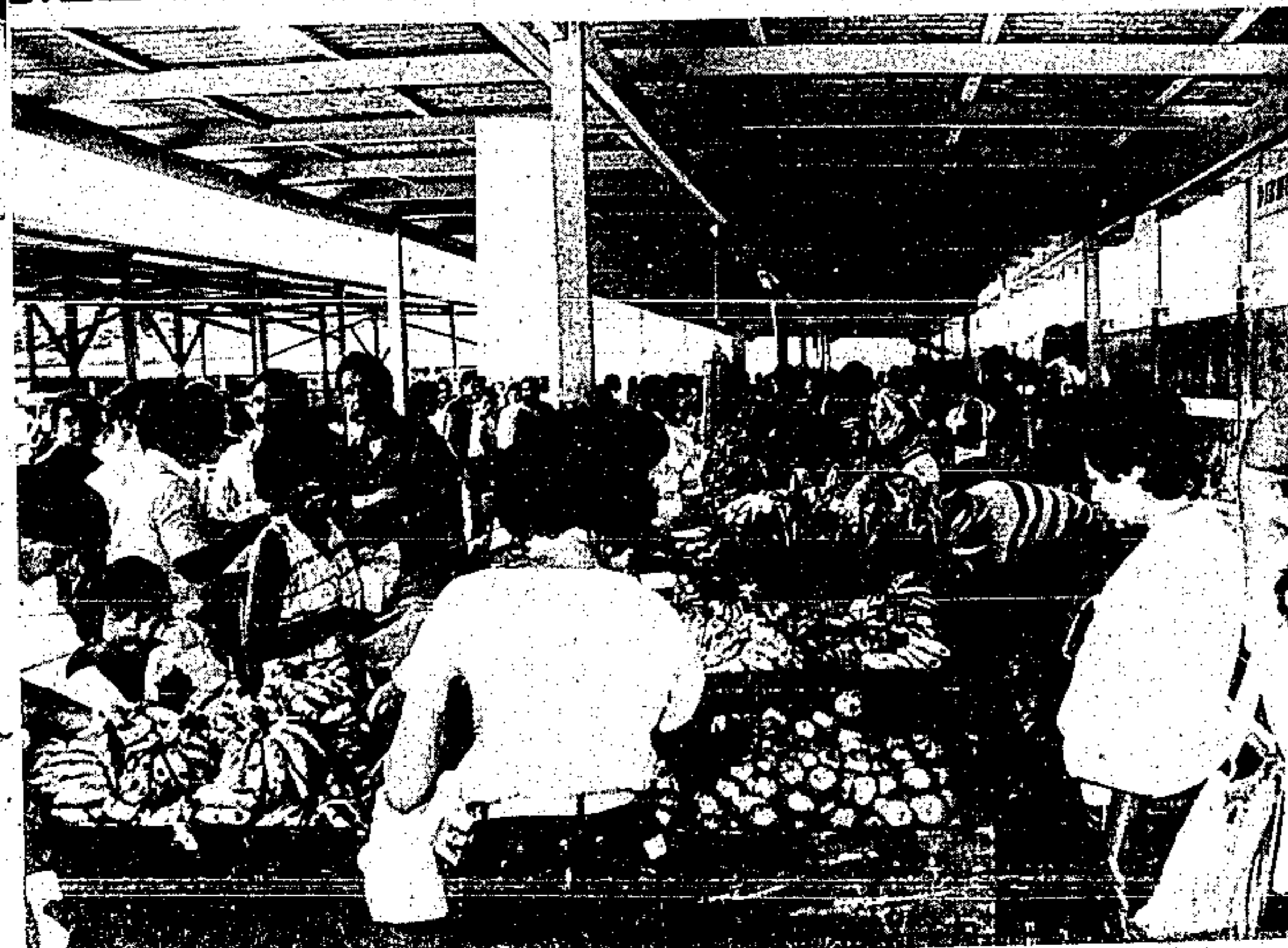
O Várzeão dos funcionários públicos aumenta número de consumidores