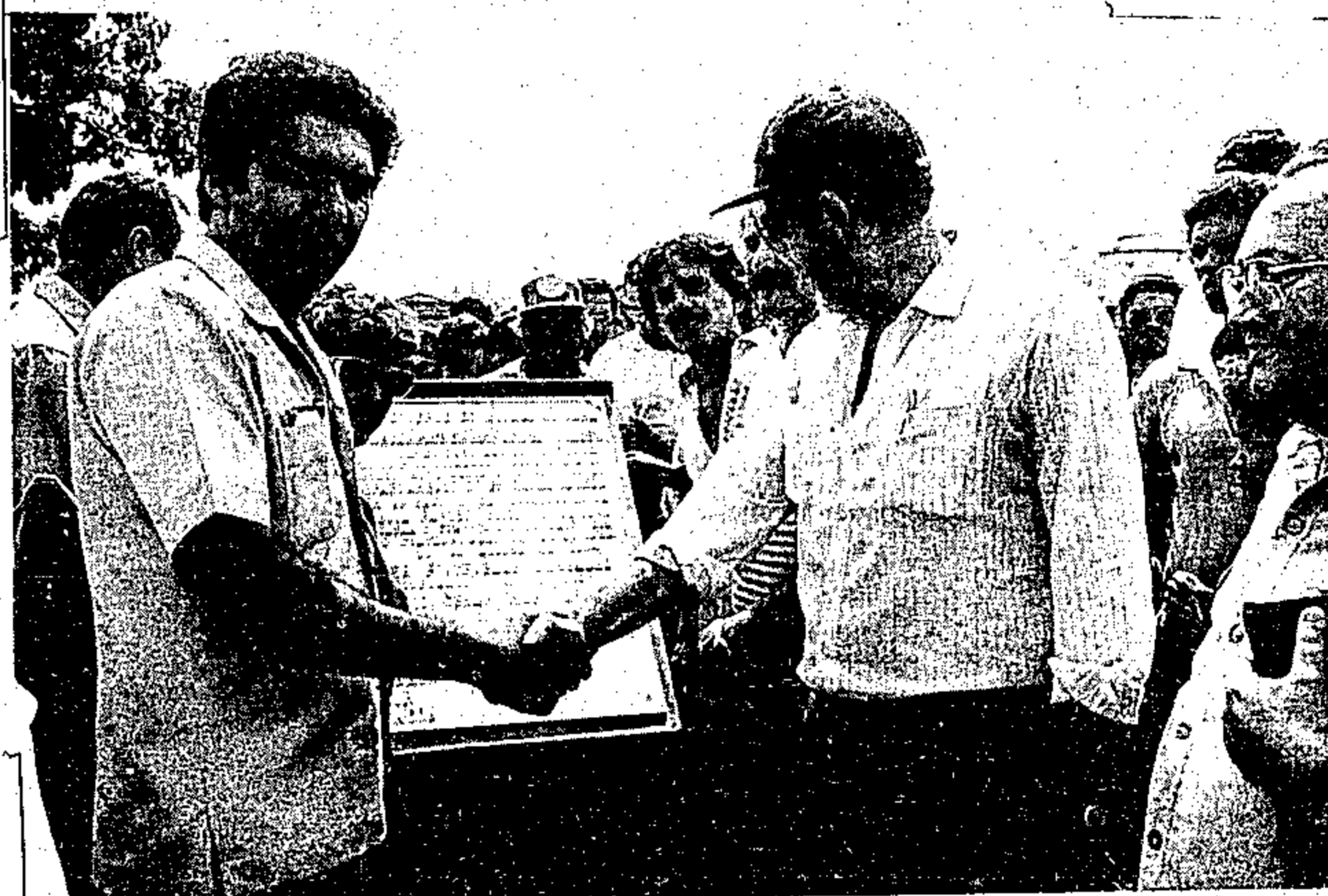
O governador Jader Barbalho quando inaugurava o primeiro trecho asfaltado da rodovia

A priorização da construção da rodovia PA-150 e suas vicinais condiciona um desenvolvimento esperado pelos setores que geram a economia do Estado, haja visto constituir-se fator preponderante para o progresso de qualquer sistema sócio-econômico, a existência de vias de comunicação de transportes. E numa região como a Amazônia, as dificuldades de estradas tornaram por muitos anos um desenvolvimento lento, pelos fatores adversos. Entretanto, com atitudes administrativas como as que vêm sendo postas em prática pelo governador Jader Barbalho, no que consiste especialmente às soluções de transportes tão esperadas, abre-se uma perspectiva favorável ao surto de progresso que está determinado para o Estado.