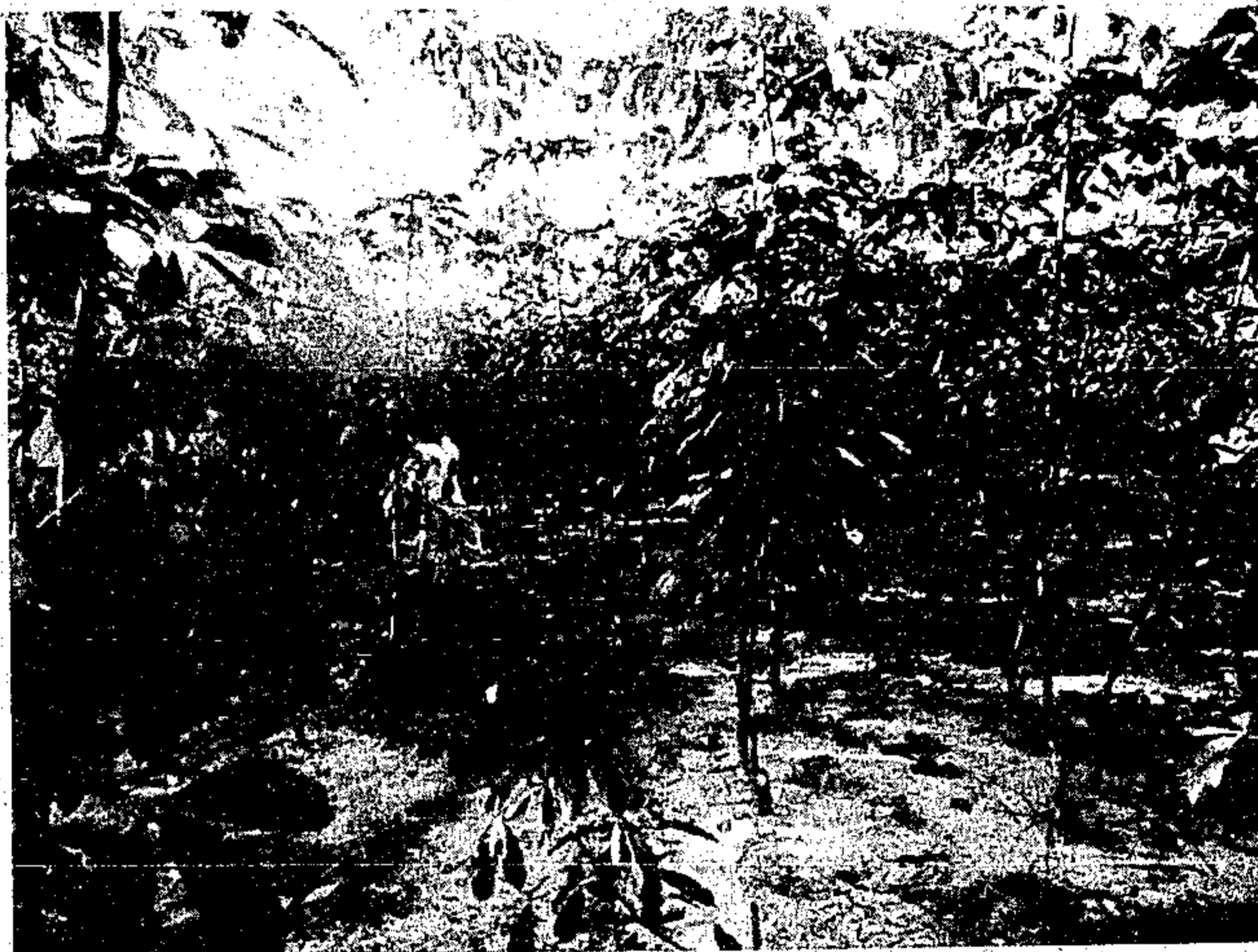
A seringueira precisa de mais recursos para a sua incrementação

02 - Linhas de crédito rural com taxas de 35 por cento A.A. de correção monetária, mais 3 por cento A.A. de juros reais, para culturas de algodão, abacaxi, melão, mamão, banana, maracujá, para culturas de ciclo longo, como fruteiras (cítrus, cupuaçu, bacuri, graviola, açaí, pupunha e outras fruteiras essenciais florestais) mesmo encargo financeiro