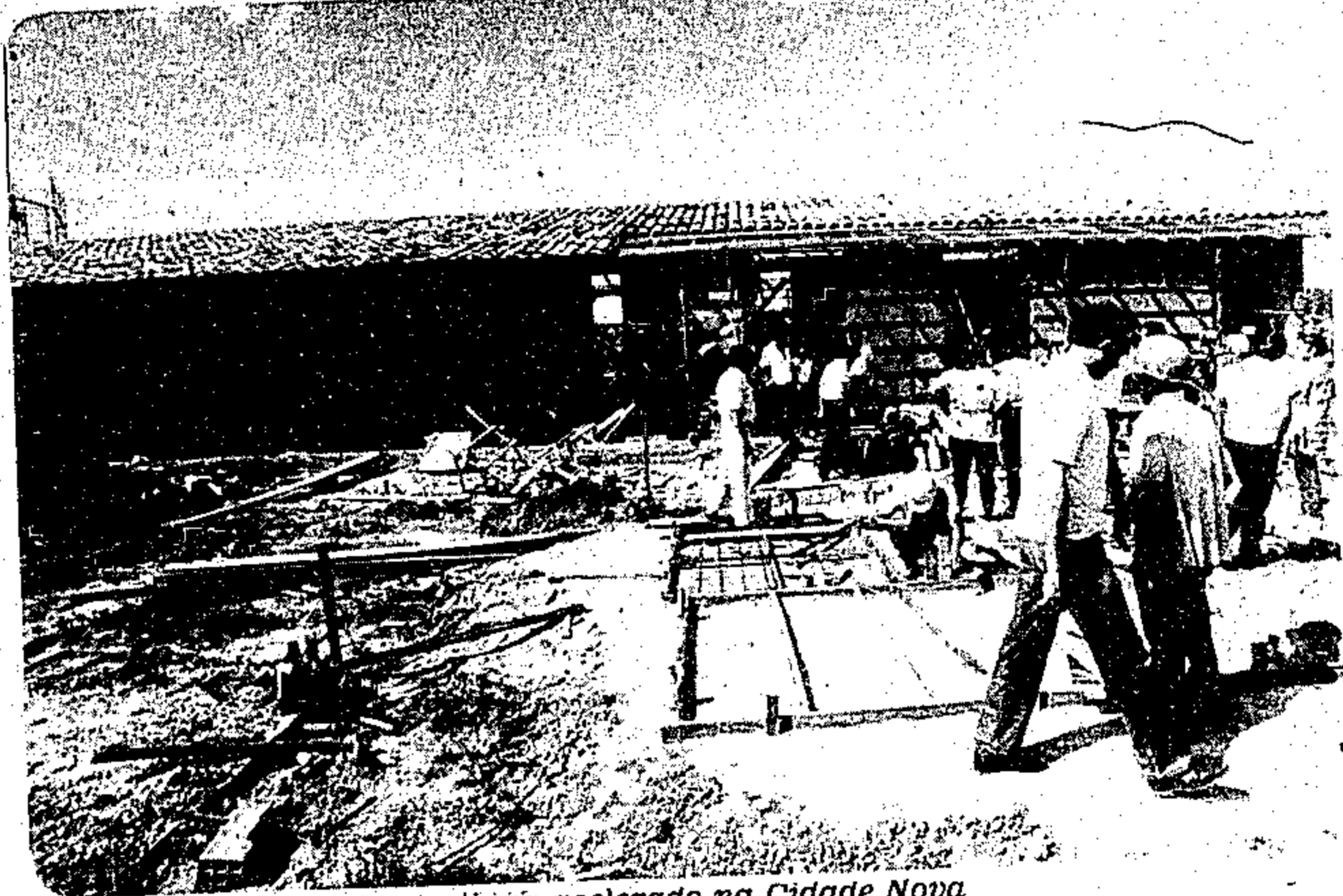
O ritmo de construção continua acelerado na Cidade Nova

A Cohab iniciou em dezembro contatos com prefeituras do interior para a construção de 500 casas do Projeto Ficom IV - Programa de Financiamento para Construção, Aquisição e Melhoria da Habitação de Interesse Social conforme autorização recebida do diretor de programas habitacionais do Banco Nacional de Habitação, Antonio Esmeraldo Neto. De acordo com Salomão Elgrably, coordenador do Ficom, é mais um passo rumo à interiorização da