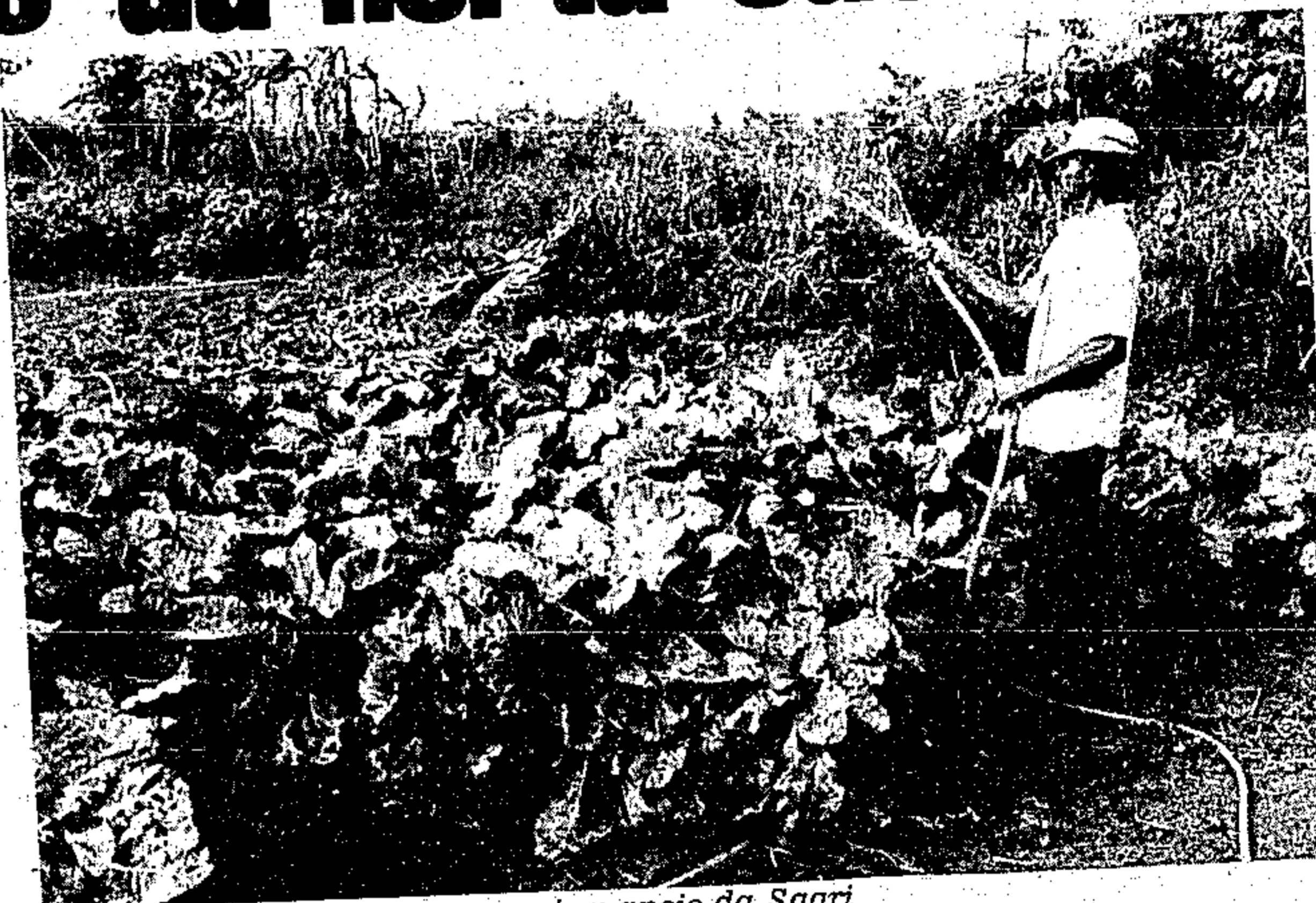
Horta caseira: uma solução que tem apoio da Sagri

Os encontros servem de incentivo para que as pessoas