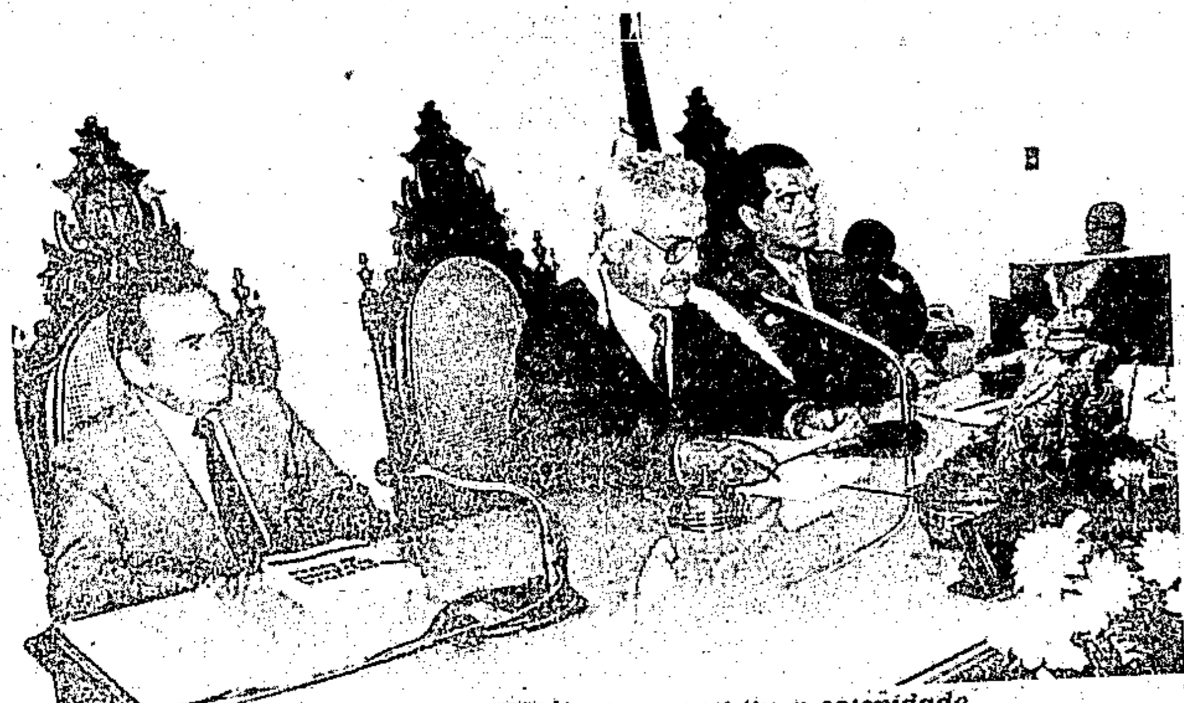
O desembargador Ary da Motta Silveira presidiu a solenidade

Foi distribuída a revista do TJE, volume nº 38 aos presentes.