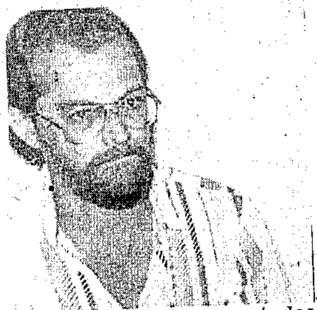
Venturini: vagas para todos

BELEM - QUINTA-FEIRA, 06 DE FEVEREIRO DE 1986