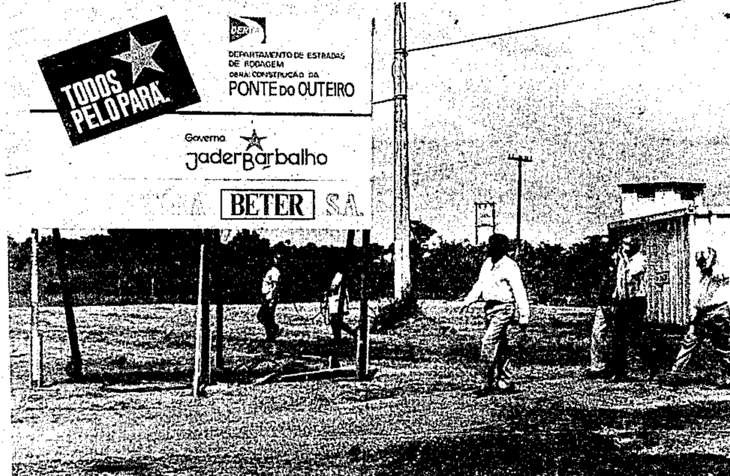
O Governador Jader Barbalho visitou o canteiro de obras

O Governador Jader Barbalho, após visitar o canteiro de obras da ponte do Outeiro, dirigiu-se com sua comitiva para inspecionar o andamento das obras de construção das sedes da Emater-Empresa de Assistência Técnica e Extensão Rural e do Prodepa - Processamento de Dados do Estado do Pará, localizadas na Rodovia Augusto Montenegro, previstas para serem entregues antes do final deste trimestre. A construção, faz parte da política do governador Jader Barbalho que está dando início a um processo de descentralização, transferindo paulatinamente para a Rodovia