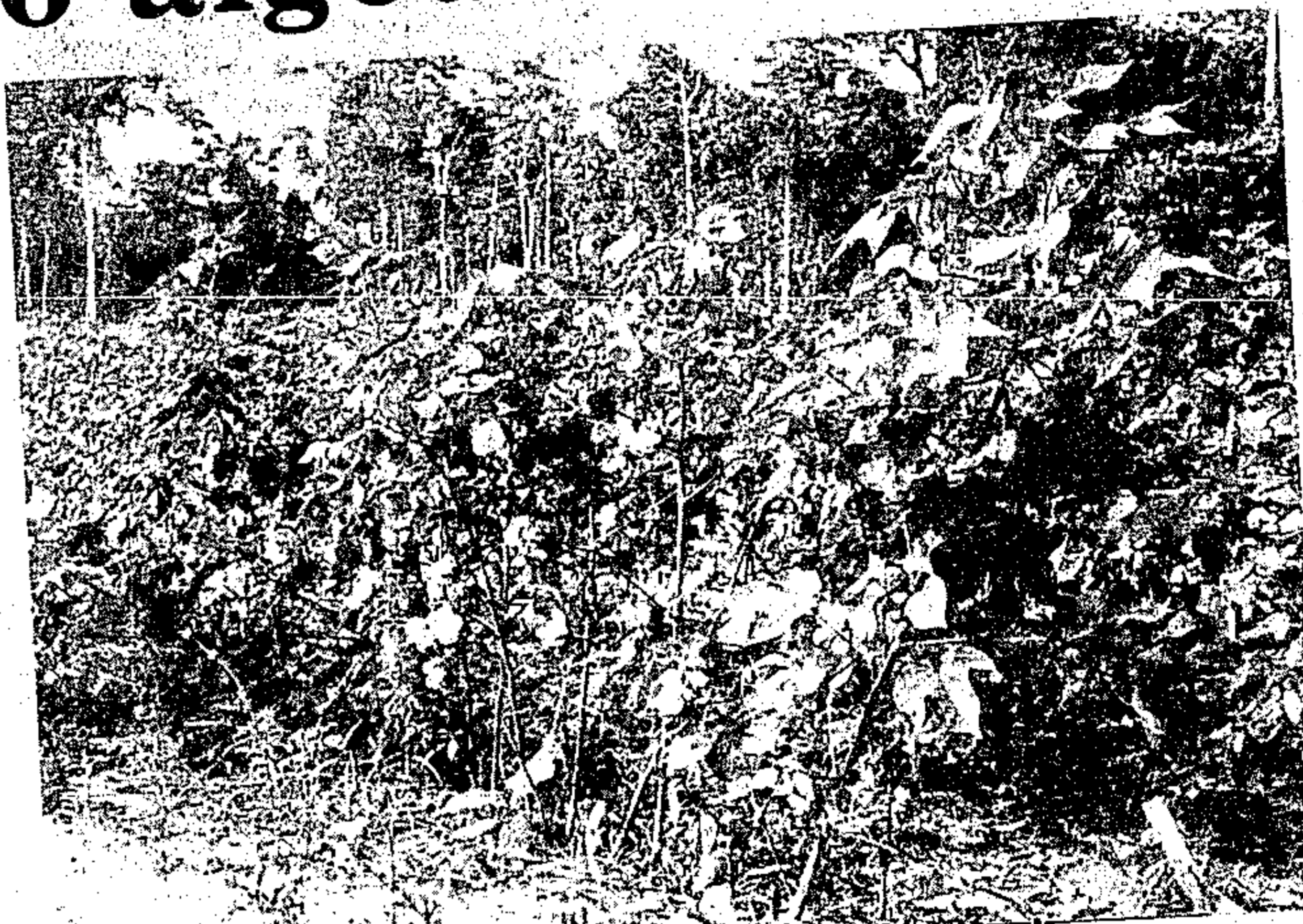
Em nosso Estado, é promissora a produção algodoeira

Em Capanema e Monte Alegre estão instaladas indústrias equipadas com maquinárias próprias para o beneficiamento desse algodão, não servindo para beneficiar nenhum tipo de fibra curta. Servem, exclusivamente, para tratar do "Acalla Del Cerro", que posteriormente será produzido em várias áreas do nosso Estado.