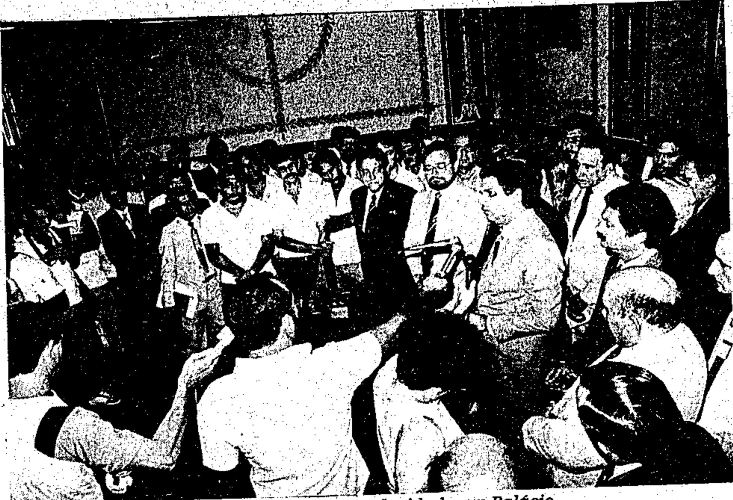
O governador Jader Barbalho presidiu a solenidade, em Palácio