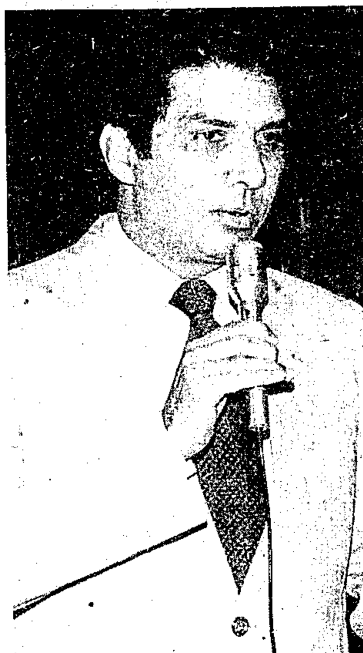
No encontro com o ministro da Agricultura, o governador defendeu a classe

timentos aprovados nessa reunião foi da ordem de quinhentos milhões de cruzados".