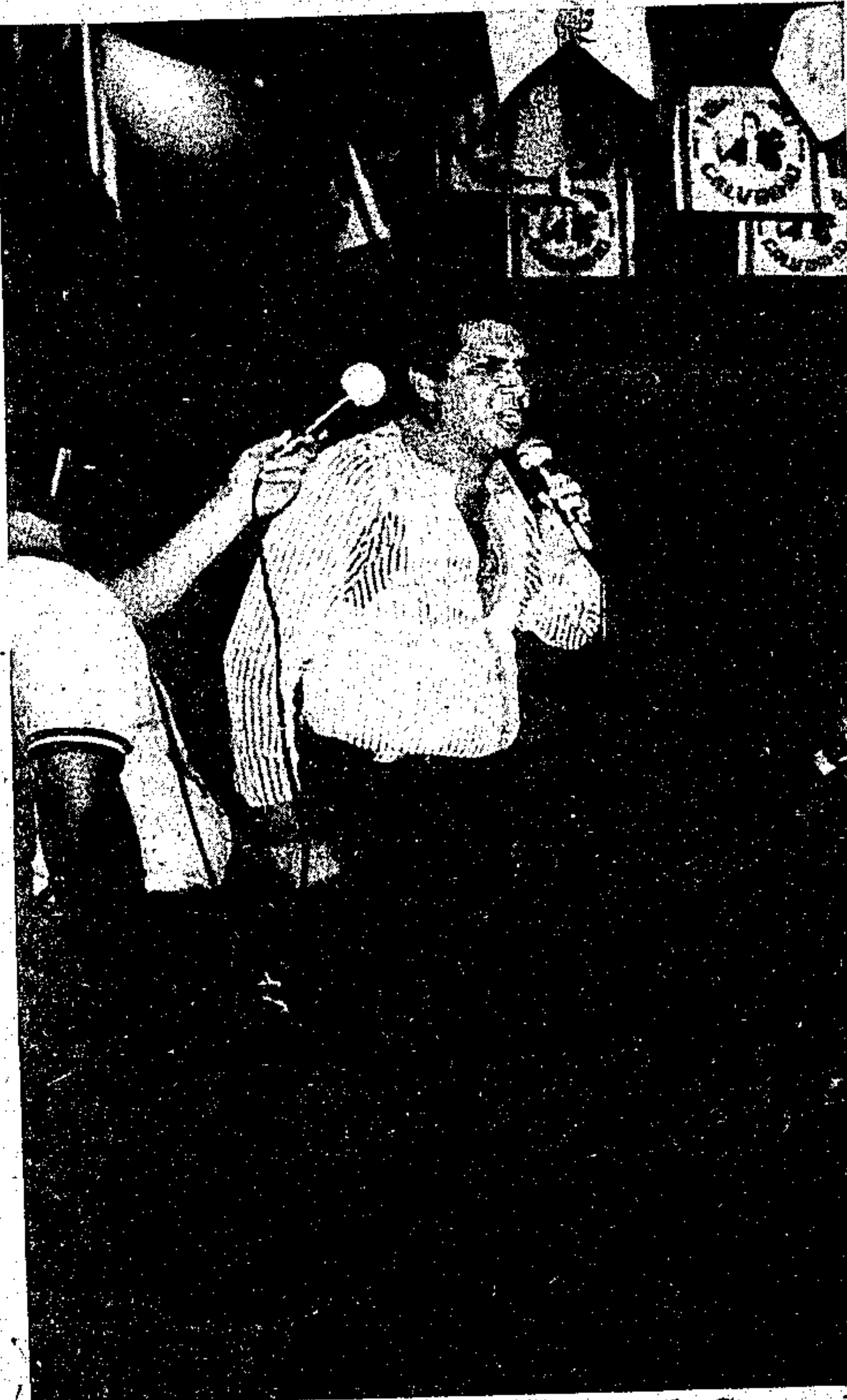
O governador fala no adeus da usina da Cremação

Ali vinham sendo incineradas diariamente duzentas toneladas de lixo de todas as procedências, por um processo arcaico e grandemente prejudicial, pois determinadas horas a fumaça despreendida do forno crematório anuviava as vias públicas e penetrava nas residências, impedindo a perfeita visibilidade e sufocando pessoas e animais, por vezes causando vômitos e quase desmaios. Por isso tudo, os moradores que combatiam a manutenção ali da usina expressaram o seu