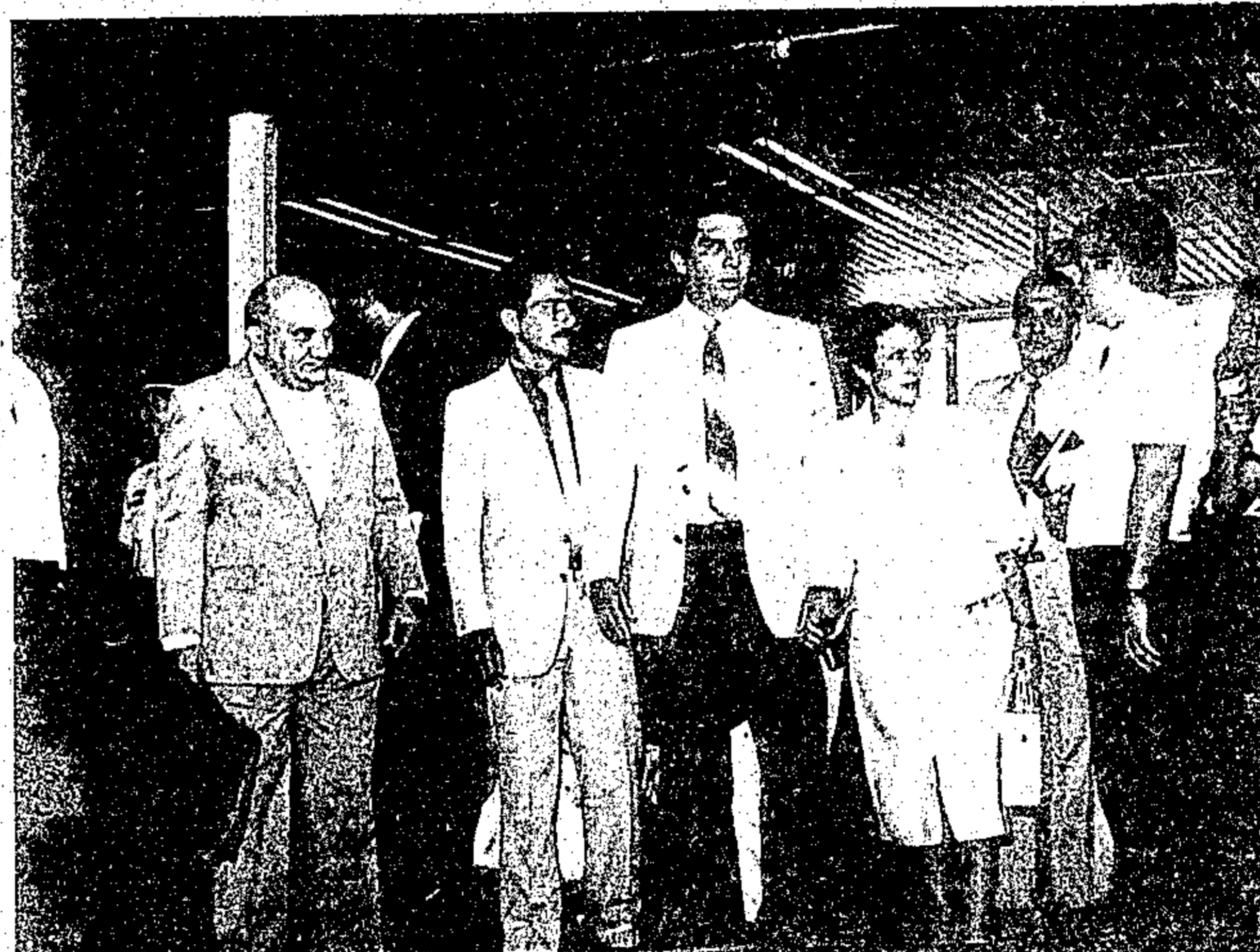
O governador no Centro Turístico e Cultural Tancredo Neves

Esse Projeto de Lei será apreciado pela Assembléia Legislativa do Estado nas próximas semanas, para que antes do fim do mês possa ser sancionado, provavelmente dia 28, em sessão magna de inauguração do Centur, a que estará presente como convidada especial a viúva do presidente Tancredo Neves. Com isso, é aberto o crédito especial de três milhões de cruzados, para completa instalação e manu-