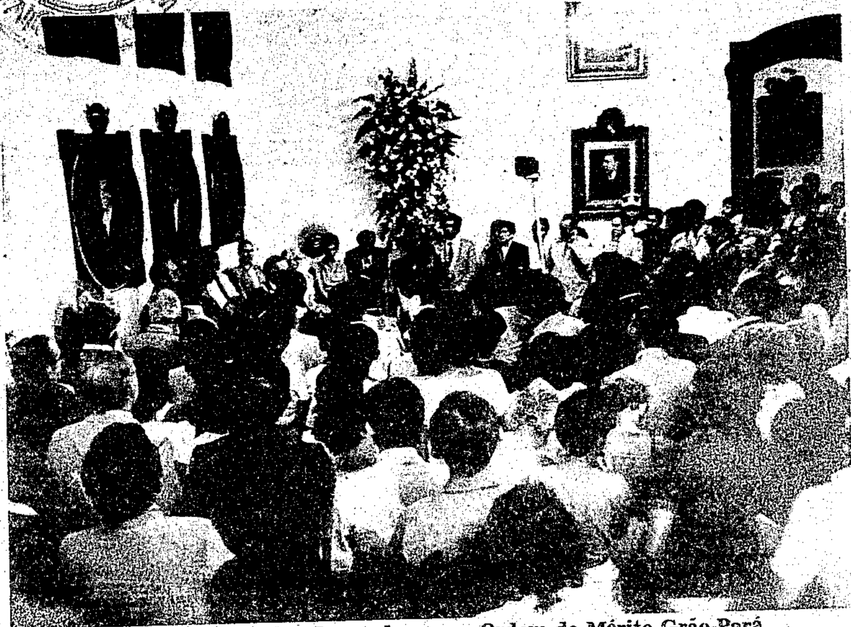
O ex-titular do Mirad foi condecorado com a Ordem do Mérito Grão-Pará