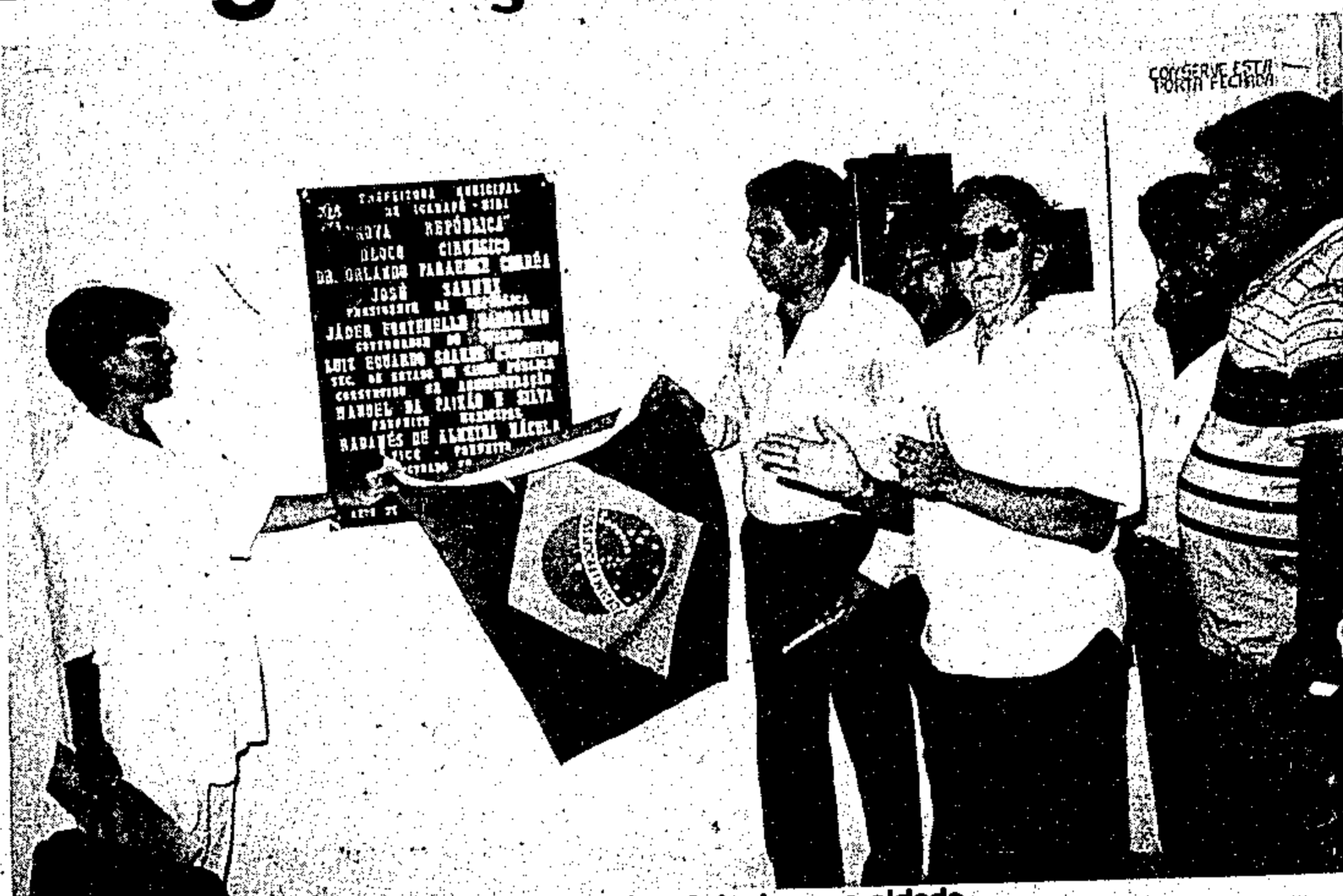
O governador na inauguração de um bloco cirúrgico, na cidade

Ao final, Jader Barbalho atendeu, na Casa da Cultura, representantes da comunidade local, ouvindo suas reivindicações e dizendo dos seus propósitos como administrador do Estado.