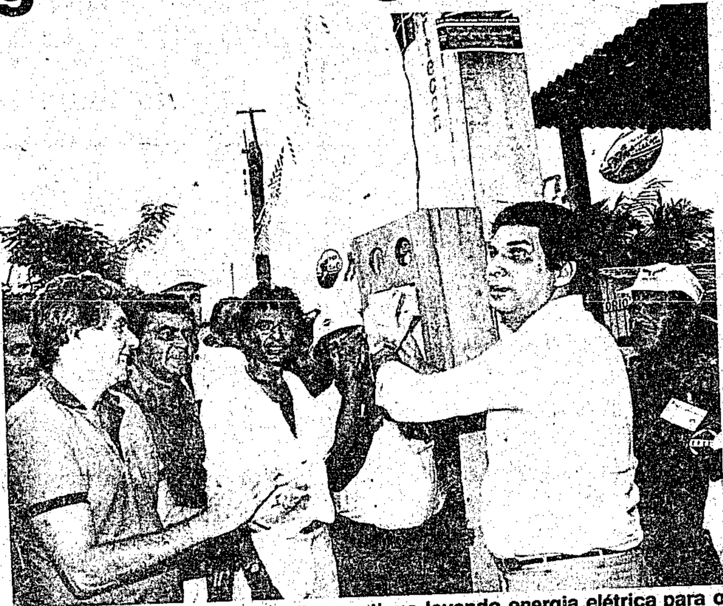
O Governo Jader Barbalho continua levando energia elétrica para o interior

Já a segunda etapa consistiu de obras relativas ao sistema de adução, havendo sido assentados tubos de PVC numa extensão de 120 metros, a partir da casa de bombas. Por fim, montou-se a sequência de tubos de PVC que formam a rede d'água propriamente dita, num total de 3.192 metros alcançando os lares de 268 usuários. Deste total, 68 consistem em doações da Prefeitura Municipal de Castanhal e as demais (200) foram