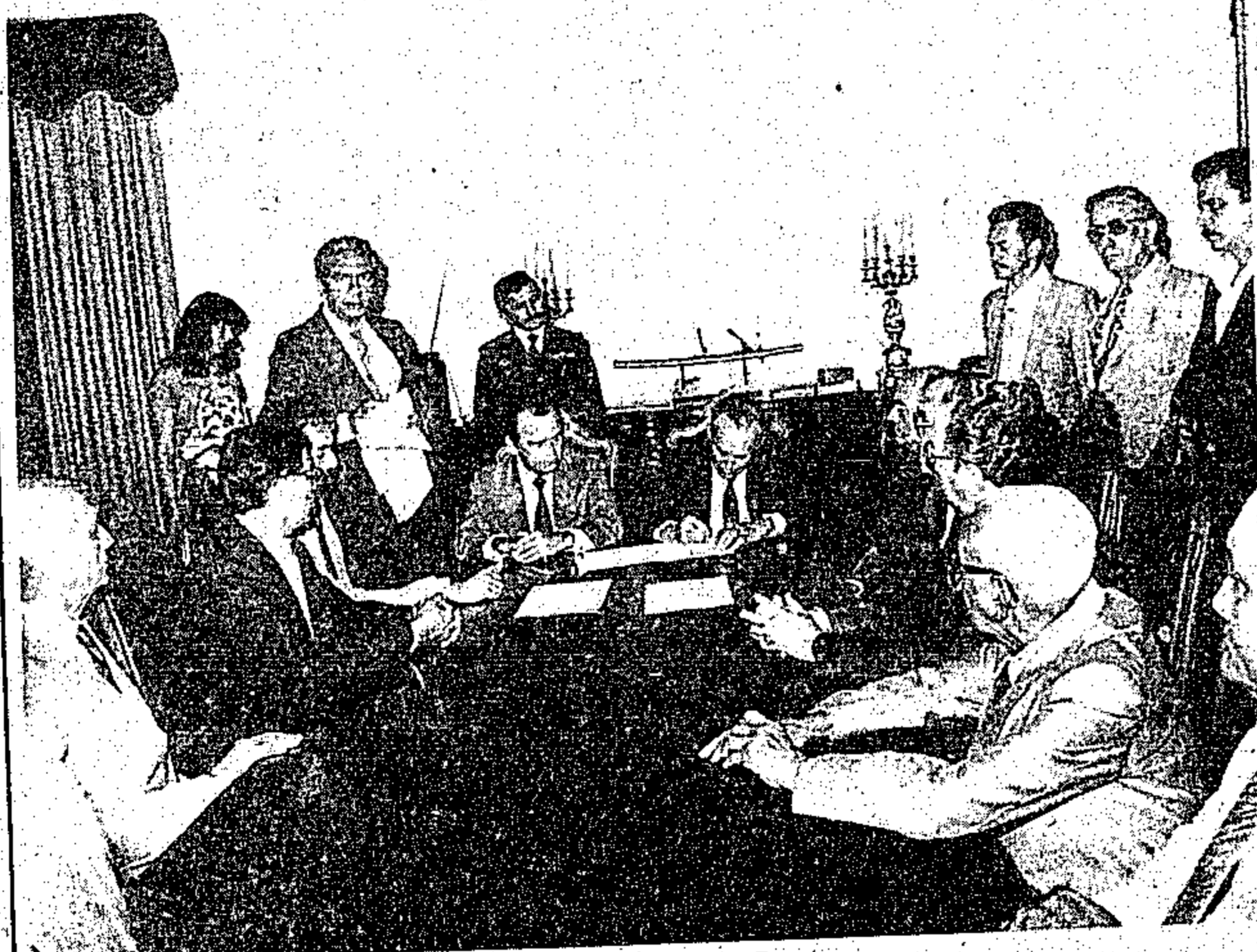
O convênio foi assinado com o superintendente da Sunaman