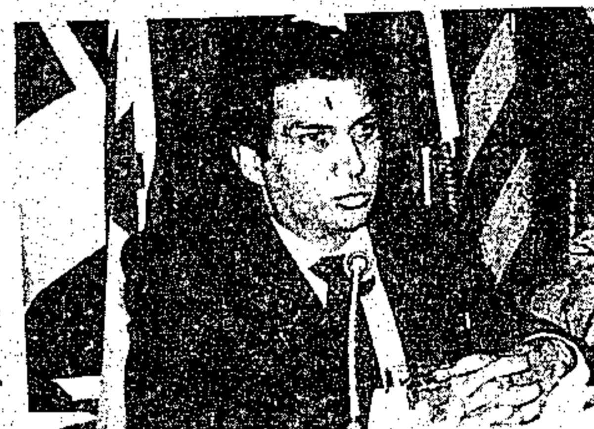
Jader tratou de assuntos do Estado

posseiros. Foi explicado ao chefe da nação que o problema nessa área paraense está mais complicado, com a mineração, já que foram expedidos pelo governo anterior 33 Alvarás de Pesquisa e Lavra, havendo, agora, além da questão possessória dessa superfície territorial, desentendimento quanto ao direito de mineração. Disse o governador Jader Barbalho, ainda se referindo à Gleba Cidapar, que passou a existir "um conflito entre garimpeiros e a empresa mineral".