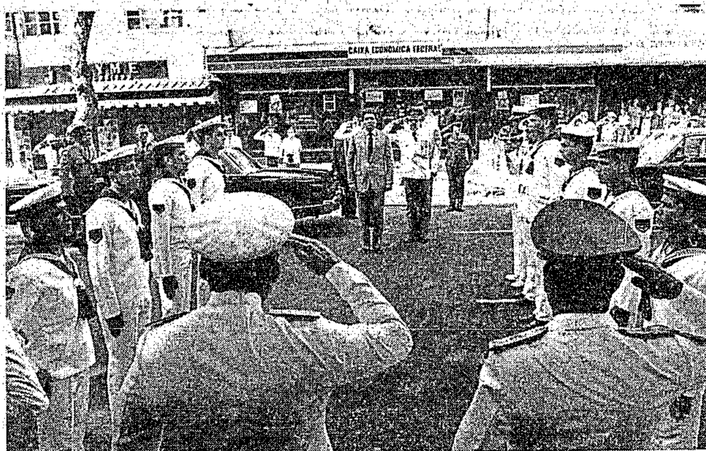
O governador participou das comemorações em homenagem à Independência.

Para assistirem o desfile, realizado sexta-feira última com quatro horas de duração, milhares de pessoas ficaram ao longo da Avenida Presidente Vargas e Serze-