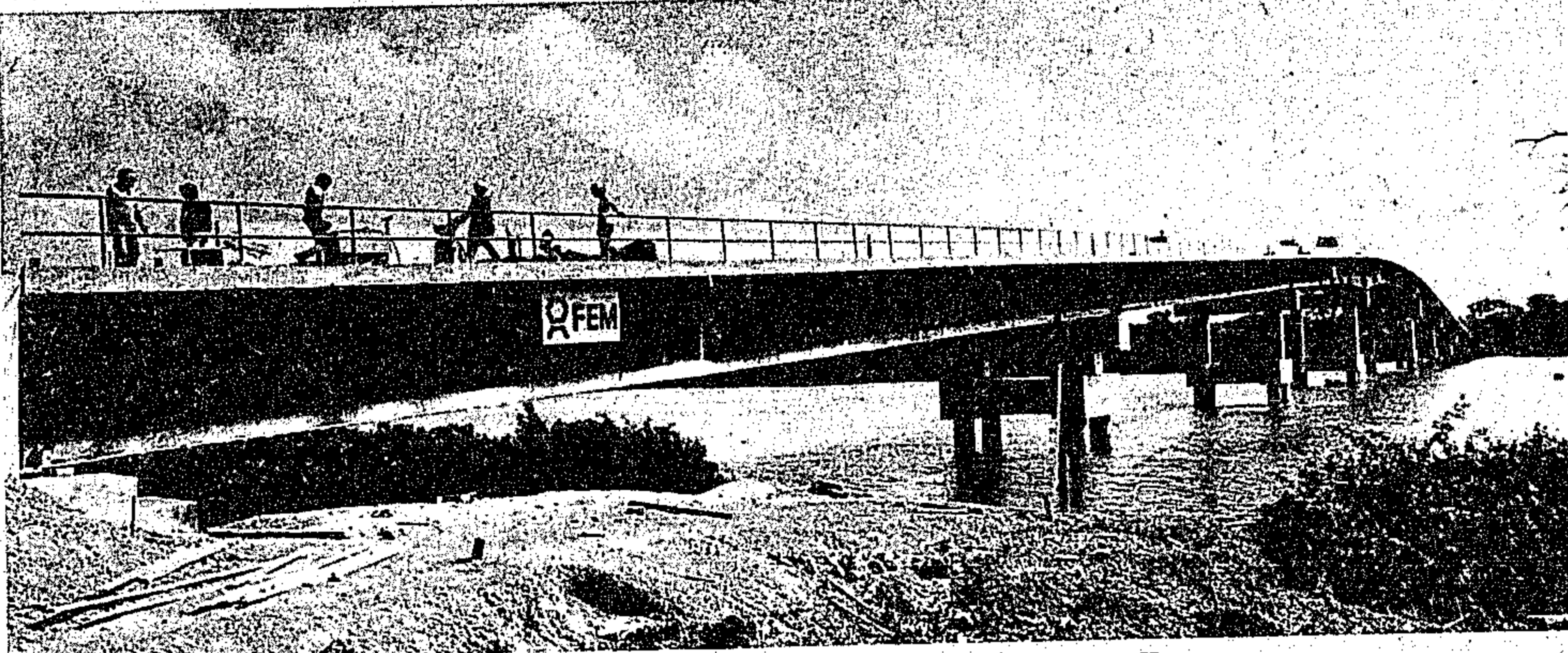
A ponte sobre o rio Maguari tornou-se realidade no Governo Jader Barbalho