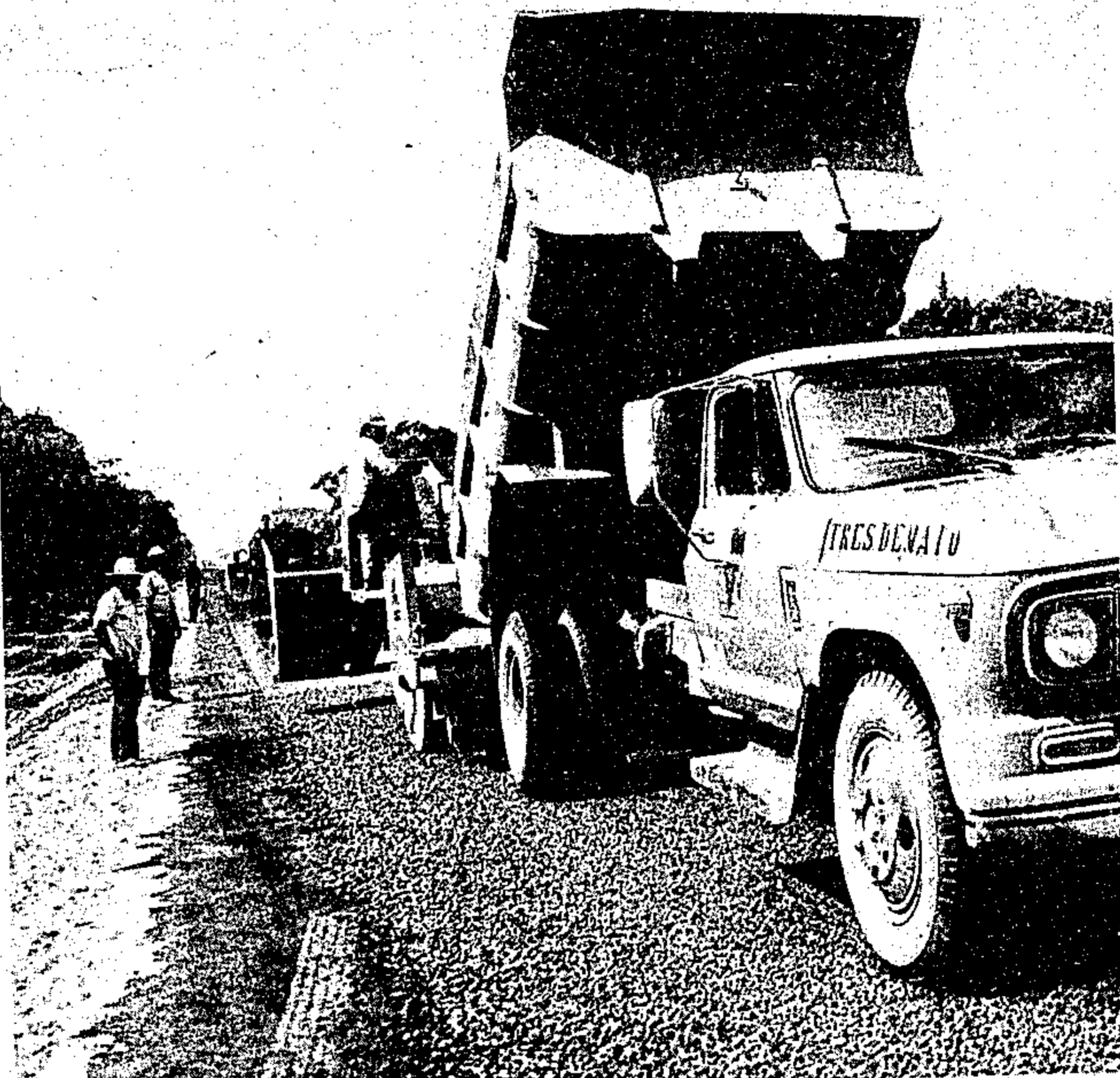
Em ritmo acelerado, o DER concluiu quase 700 quilômetros de rodovia asfaltada

Do Plano Rodoviário Estadual posto em execução no Governo Jader Barbalho, não constou como obra prioritária apenas a PA-150 dando-se ênfase ao trecho de 473 quilômetros que vão de Moju a Santana do Araguaia (passando por Tailândia, Goianésia Jacundá Novo, Marabá, Xinguara, Rio Maria, Redenção e localidades menos importantes): foram incluídos 207 quilômetros de pavimentação em vários subtrechos e em outras estradas que ligam vilas e