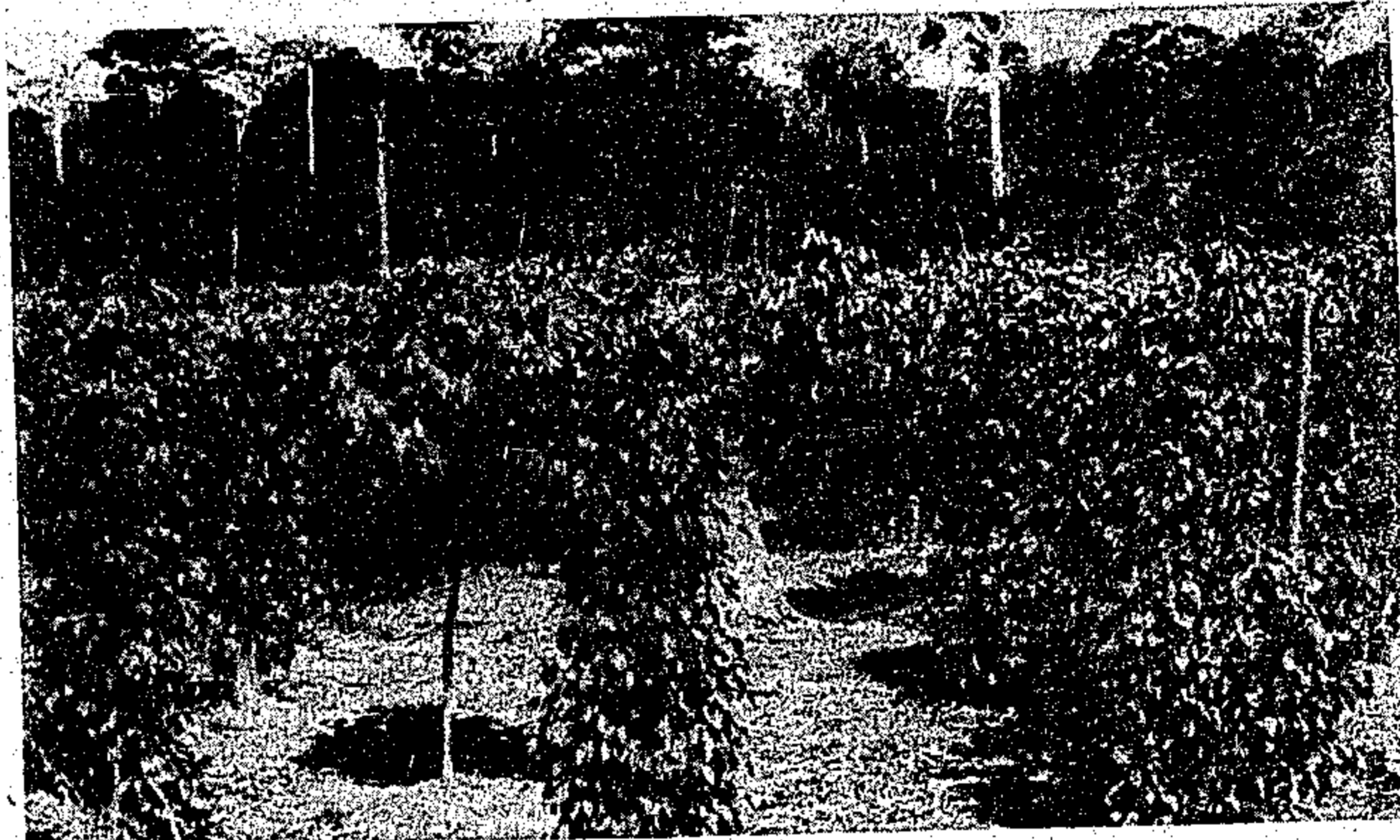
Produção de pimenta do reino é a meta da Sagri

O plantio da pimenta-do-reino deve ser feito em áreas adequadas, através das operações comuns de broca, derruba, queima, encoivramento e de estocamento, vindo em seguida a demarcação do terreno para a fixação das covas com enchimento de terra preta e matéria orgânica que pode ser esterco de animal ou resíduo orgânico vegetal, como andiroba, algodão ou ucuuba. Após trinta a quarenta dias ocorre o plantio, realizado em geral entre os meses de janeiro e fevereiro no início das chuvas. Os tratos culturais são feitos depois