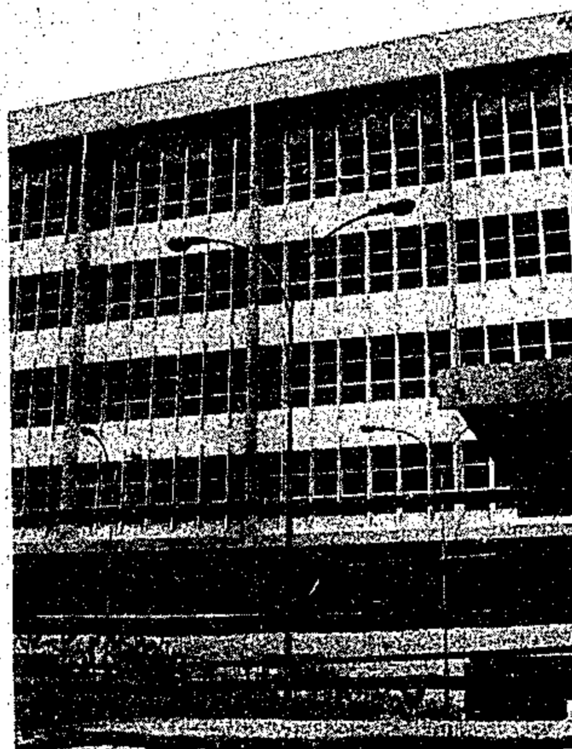
No Centur, um presépio amazônico

Além do presépio colocado à visitação, para a quadra natalina, o Centur funcionará com atrativos a mais, que em sua maior parte ainda estão em fase de organização, num conjunto de esforços visando atrair sobretudo as crianças. A programação já aprovada e que teve início ontem com o cinema infantil "Maneco, o supertio"