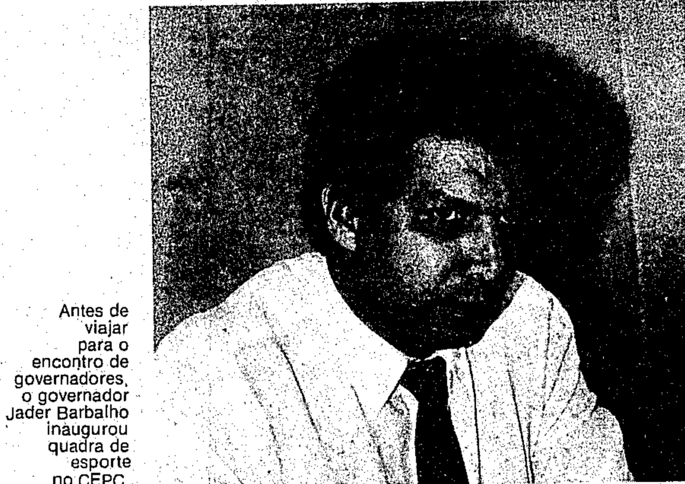
Antes de viajar para o encontro de governadores, o governador Jader Barbalho inaugurou quadra de esporte no CEPC.

Avisamos aos nossos usuários a partir do dia 1º de janeiro do ano vindouro a tabela de preços para publicações no Diário Oficial do Estado sofrerá um reajuste, passando a ser cobrado o centímetro Cz$ 98,10 (noventa e oito cruzados e dez centavos) e o preço da página comum a razão de Cz$ 20.013,32 (vinte mil, treze cruzados e trinta e dois centavos).