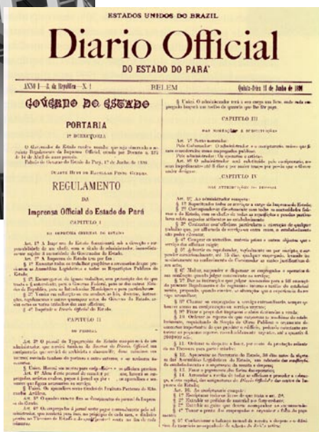
Fac-simile da primeira edição do DOE

E m uma quinta-feira do dia 11 de junho de 1891 circulou a primeira edição do Diário Oficial, com oito páginas, saindo de oficinas próprias instaladas no prédio situado na Praça da Independência, atual Praça D. Pedro II, local onde atualmente funciona o Palácio Cabanagem, sede do Poder Legislativo do Estado. Estava no Governo do Estado o capitão de Mar-e-Guerra Duarte Huet de Bacellar Pinto Guedes, em substituição ao dr. Justo Leite Chermont.