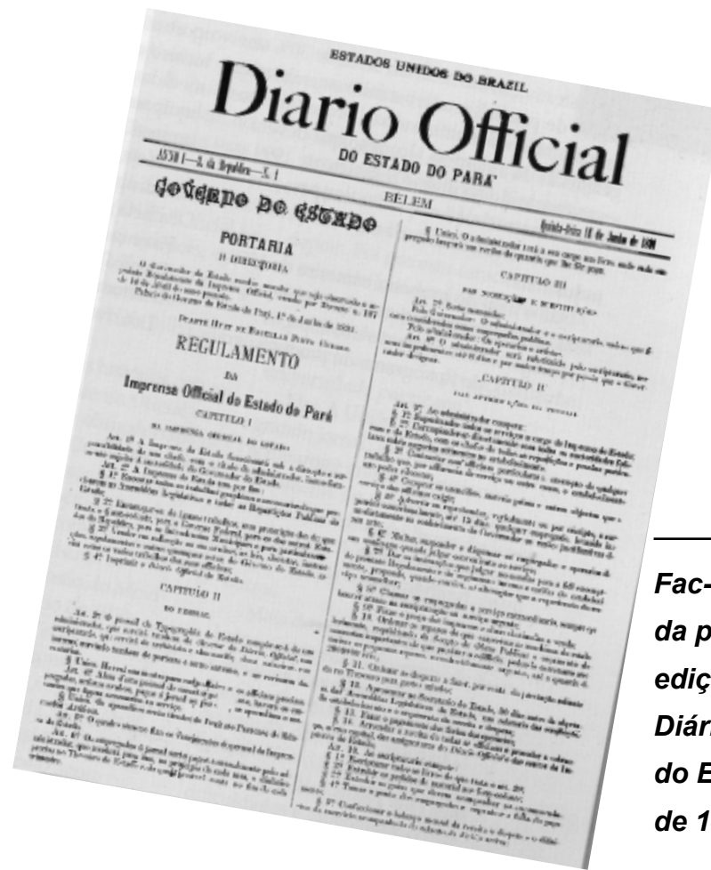
Fac-símile da primeira edição do Diário Oficial do Estado, de 1891