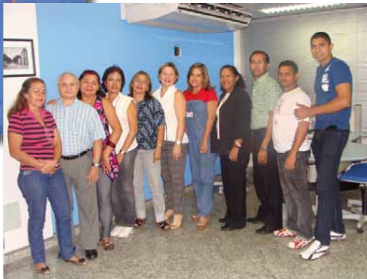
Acima, equipe da Rotativa. Ao lado, grupo que atua na Loja. Nos detalhes, servidores que compõem a Editoração.