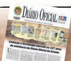
Capa comemorativa dos 127 anos do Diário Oficial do Estado, veiculada na Edição nº 33.634. Textos: Ronaldo Quadros (DRT/PA 1171) e Carmen Palheta (DRT/PA 1047). Edição e revisão: Carmen Palheta, Danielle Carvalho (DRT/PA 1520) e Adna Figueira (DRT/PA 1489). Fotos: Fernando Sette. Diagramação: Márcio Euclides (DRT/PA 2193).