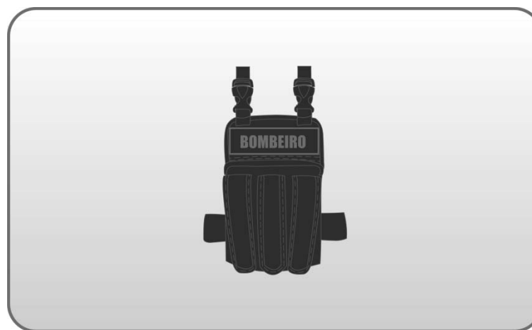
Figura 126 – Bernal tático de coxa.