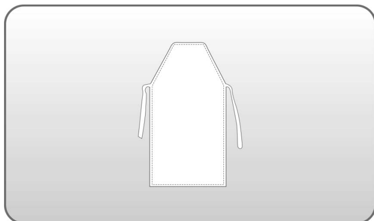
Figura 122 – Avental.