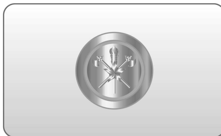
Figura 127 – Botão dourado tipo Bombeiro.