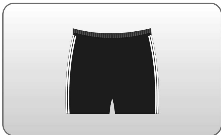
Figura 124 – Bermuda feminina preta.