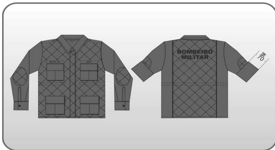
Figura 129 – Blusão (gandola) cáqui.