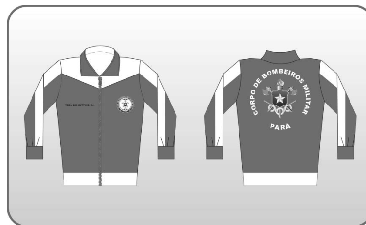
Figura 131 – Blusão do agasalho.