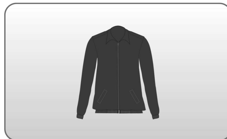
Figura 130 – Blusão de frio.