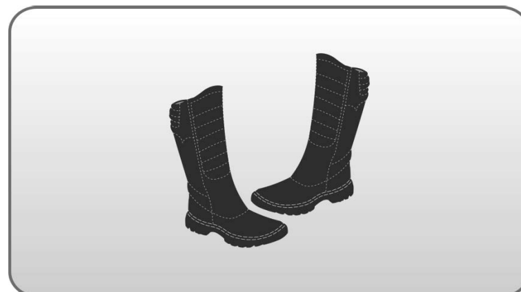
Figura 139 – Bota de cano longo.