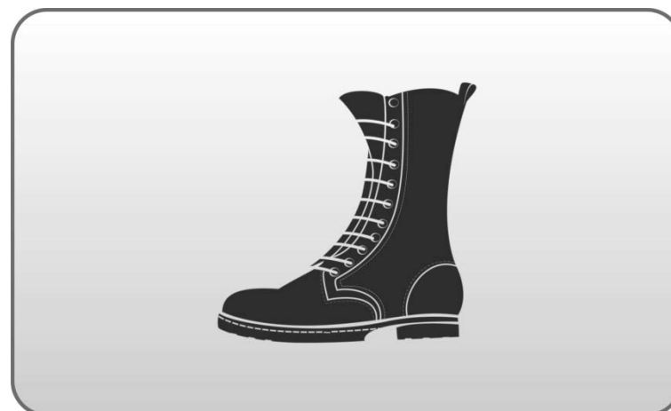
Figura 141 – Coturno.