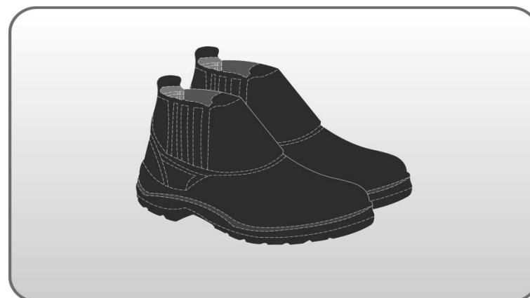
Figura 140 – Botina.