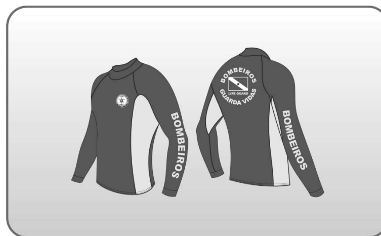
Figura 152 – Camisa manga longa de guarda-vidas.