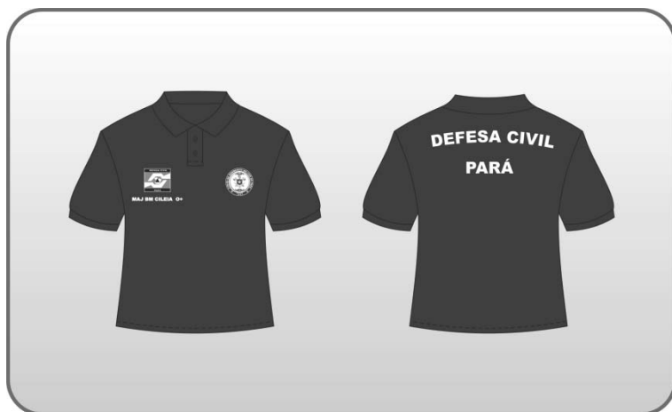
Figura 149 – Camisa de malha meia manga gola polo azul.

a) Confeccionada em tecido malha piquet, na cor azul marinho;