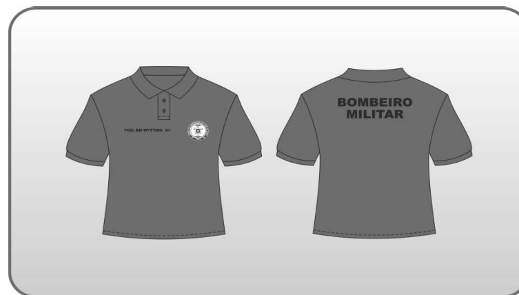
Figura 151 – Camisa de malha meia manga gola polo vermelha.

a) Confeccionada em tecido malha piquet, na cor vermelha;