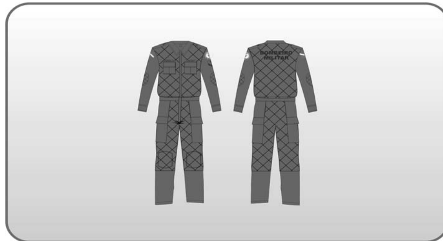
Figura 201 – Macacão de manutenção.