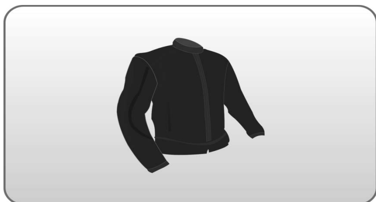
Figura 199 – Jaqueta para motociclista.