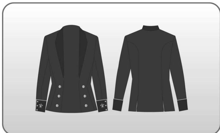
Figura 218 – Túnica feminina (jaqueta).