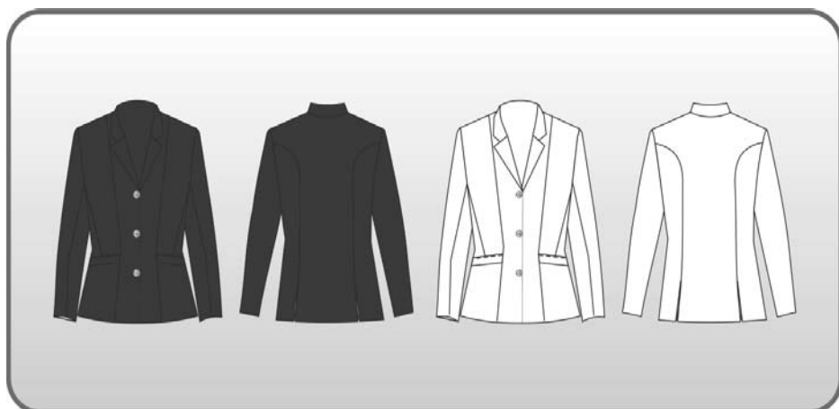
Figura 219 – Túnica feminina (azul escuro ou branca).