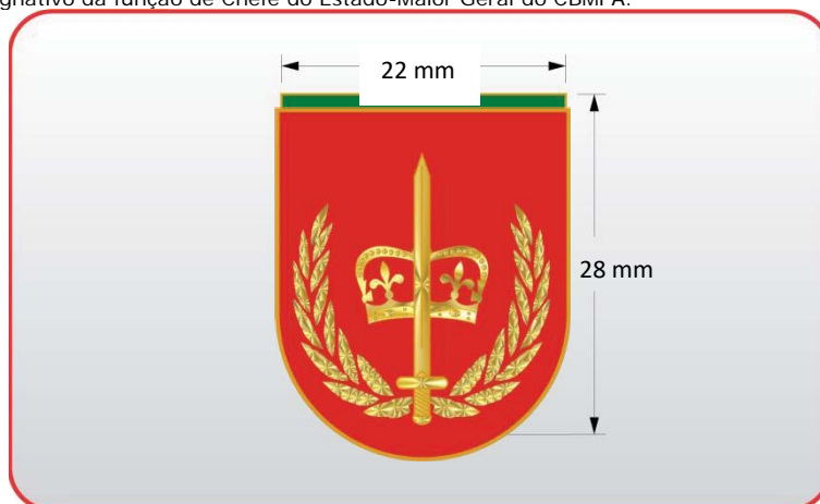
Figura 065 - Distintivo designativo da função de Chefe do Estado-Maior Geral do CBMPA.

b) Uso: será afixado acima do bolso superior direito (ou posição correspondente) das túnicas dos uniformes de gala e cerimônia, e, dos uniformes administrativos no alinhamento do seu centro a 10 mm da costura da lapela do bolso ou a 10 mm acima do último distintivo de curso utilizado."